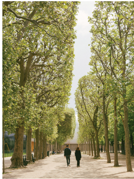
06 艾菲尔铁塔 - 巴黎观光

AMANDINE: 我认为非常有趣的是，通过他们，我们往往能捕捉到被忽视的细节。孩子们总是无比真实地活在当下。这对于我们无疑是很好的提醒。