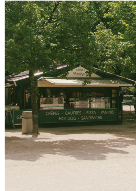
05 战神广场 - 探索巴黎

大多数人并不知道巴黎也适合家庭游。对你和家人来说，在巴黎的一个完美家庭日是怎样的？