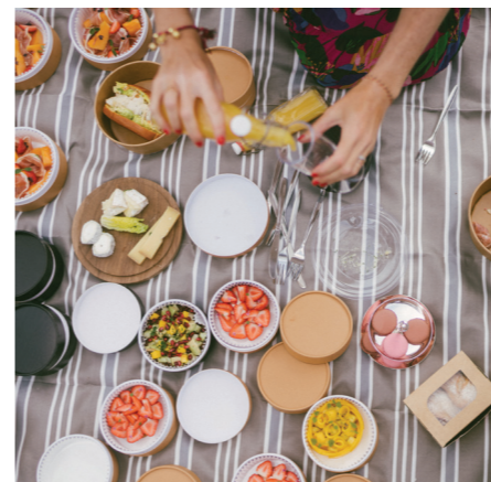
20 丰盛野餐 — 本地特产