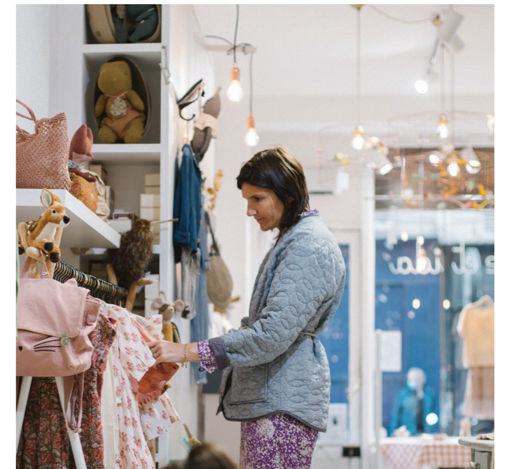
33 EMILIE ET IDA - Amandine 挑选服装

Emile和Ida注重服装的舒适与质量，以产自欧洲的天然柔软布料为婴儿、儿童和女性打造经典服饰。除拥有三家实体店之外（两家位于巴黎），品牌同样在巴黎的Le Bon Marche和美国的Barney有售。