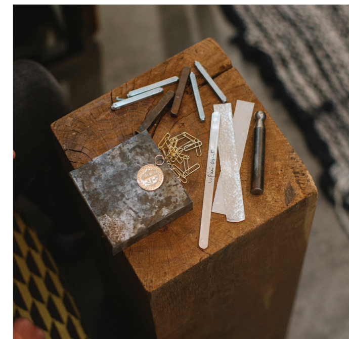
25 PAR COEUR - Amandin 挑选服装