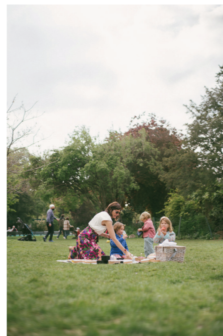
21 地点 — 野餐点