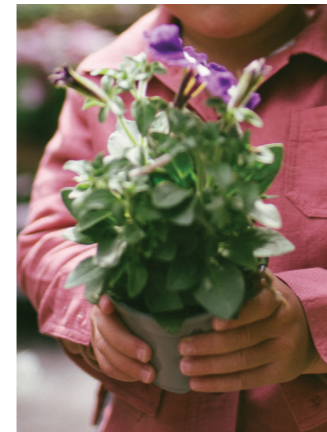
12 花卉市场 - 探索集市

AMANDINE: 于我而言，这些都是巴黎这个城市最真实的体验。简单如骑车穿行于社区，在Chez Meunier面包房购买法棍和羊角面包。这些体验深具意义同样因为它们唤起了对童年的深深回忆。