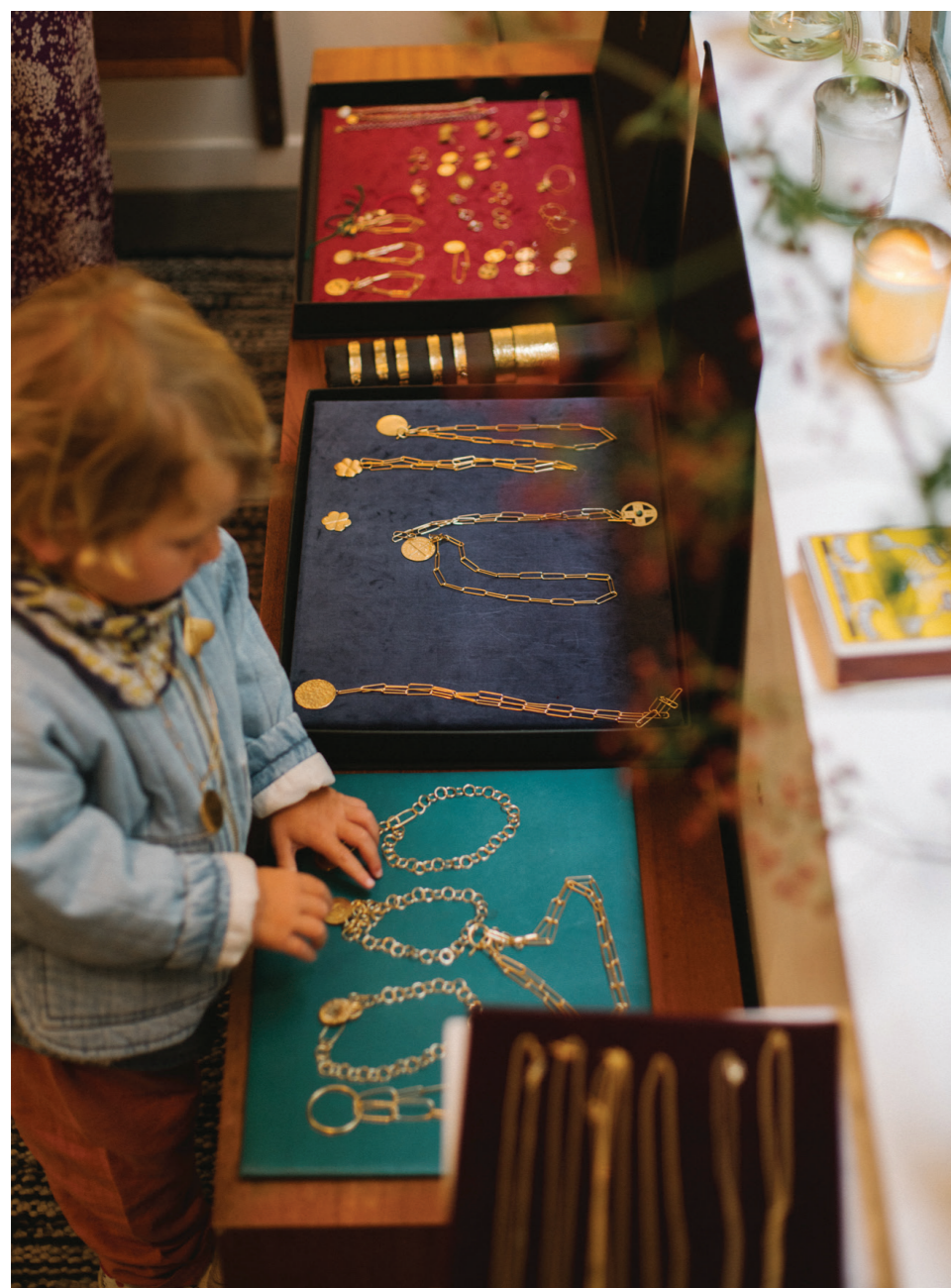
23 PAR COEUR 儿童服饰