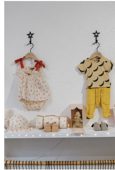
32 EMILIE ET IDA - 店铺装饰