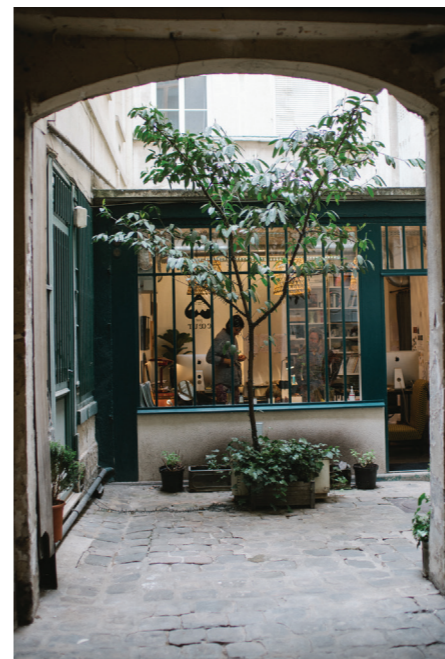
24 PAR COEUR 店铺装饰

“他们提供个性化珠宝订制，你可以把孩子的名字印刻于项链或手镯上。店主勤劳努力，用心经营。” — A